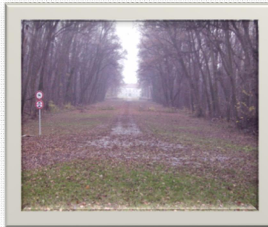
f.d.Inhalt verantwortlich: I.Ohnutek

gestaltet von dem berühmten Gartenarchitekten Dominique Girard, der vor allem als „Fontainer“ bekannt war. Bis heute sind die sternförmigen Alleen erhalten geblieben. Ein Barockgarten sollte die gezähmte, „geformte“ Natur darstellen. Ein wichtiges Element war das Wasser.